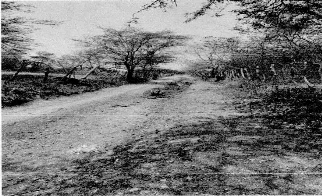
Vía Los Coco

Denuncia Ciudadana No. 0782-2024 Contrato N° LP 001-2016